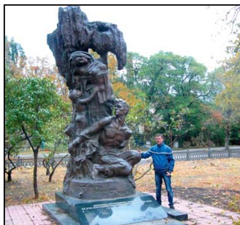
Памятник павшим от рук карателей. Монумент прошлому стал памятником настоящему.