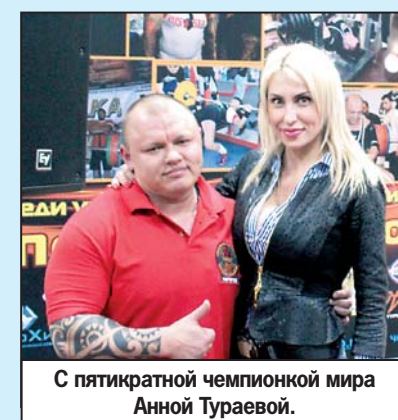
С пятикратной чемпионкой мира Анной Тураевой.

— Главная цель турнира — пропаганда здорового образа жизни. Поэтому мы приняли решение