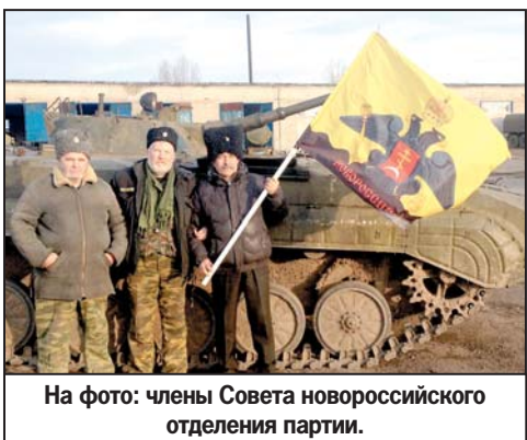
На фото: члены Совета новороссийского отделения партии.

Активисты СР отвезли гуманитарную помощь в ЛНР.