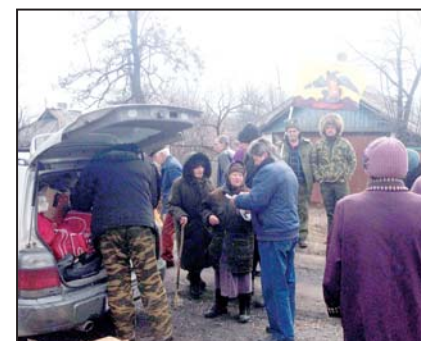
Раздача гуманитарной помощи жителям.

Ирмино — легендарный город, где зародилось и развивалось Стахановское движение — в настоящее время находится в очень бедственном положении. Граница боестолкновений проходит в 10 км от города. За все время он подвергался неоднократным артиллерийским обстрелам со стороны украинских вооруженных формирований.