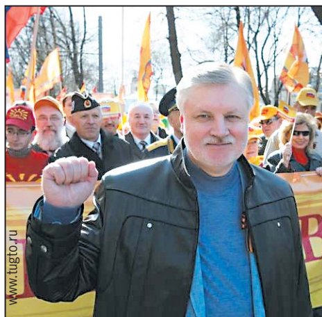
Сергей Миронов, председатель партии СПРАВЕДЛИВАЯ РОССИЯ.

Первомай — это светлый праздник, знаковый нам с самого раннего детства. Это символ солидарности, символ свободы, символ весны! Этот день партийцы и сторонники СПРАВЕДЛИВОЙ РОССИИ встретят в скверах и на площадях, чтобы поздравить друг друга и окружающих с Праздником весны и труда. Не оставайтесь в стороне и Вы.