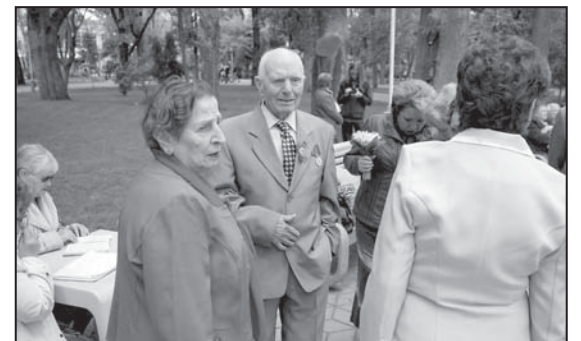
Мининг-концерт в Городском Саду в Краснодаре.

По мнению депутатов фракции «СР», идея была хорошая, но боязливо-половинчатая. Почему только 10 дней? Почему люди, которые 70 лет назад победными маршем освобождали одну за другой страны Европы, в своей собственной стране получают разовые бесплатные поездки в