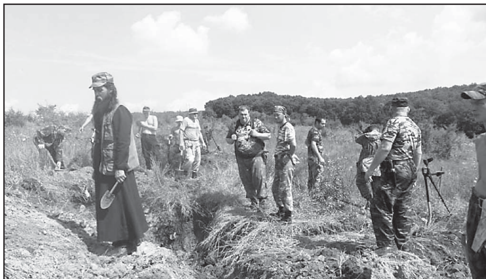
Ведем поиск (Крымский район, станция Неберджаевская, горный гребень от северной конечности станции Неберджаевской до развилки Неберджай-Новороссийск (08 - 17 июля 2013 г.)

Поисковая группа «Кавказ» во время 10-дневных раскопок в районе станции Неберджаевской Крымского района обнаружила останки павших советских