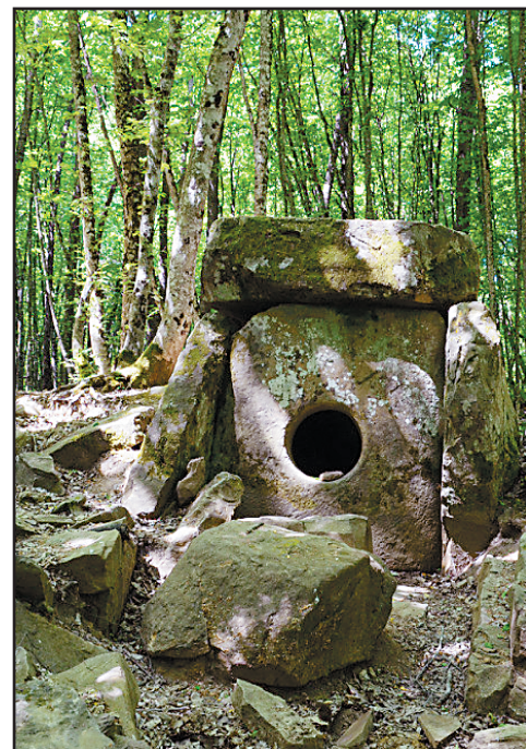
Дольмен в Абинском районе.

17 августа негодование абинчан вылилось на улицы. Сотни местных жителей с плакатами и лозунгами вышли на акцию протеста против добычи цементного сырья. Власти, в попытке не допустить митинга, шли на отчаянные шаги. Всем трем районным газетам, по словам общественников, под угрозой закрытия СМИ запретили печатать объявление об акции протеста. Как сообщили ак-