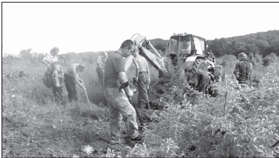
Работа с экскаватором 16 июля 2013 г.

«Кавказ» официально существует уже три года. За это время благодаря поисковым работам найдены останки 150-ти военнослужащих. С организацией сотрудничают 120 поисковиков со всего юга России.