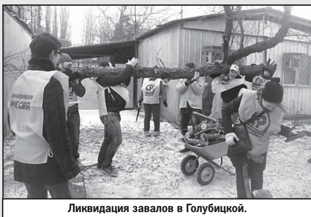
Ликвидация завалов в Голубицкой.

Подобную акцию провели активисты регионального отделения СР в Краснодаре совместно с ребятами из молодежно-