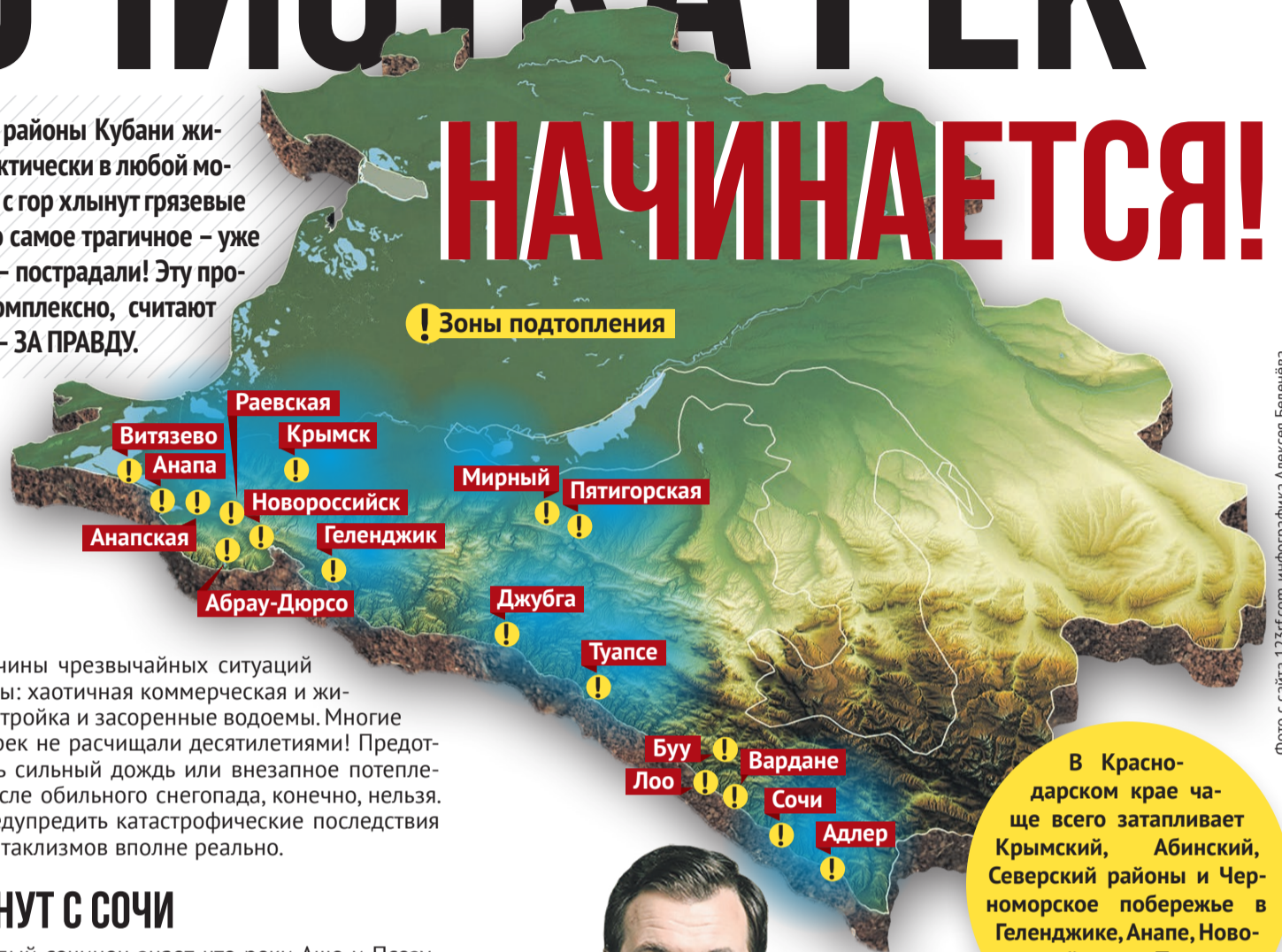
Фото с сайта 123rf.com, инфографика Алексея Беленева

Каждый год и круглый год многие районы Кубани живут словно на пороховой бочке. Практически в любой момент реки могут выйти из берегов, а с гор хлынут грязевые потоки. Ущерб — на миллиарды. Но самое трагичное — уже погибли десятки человек, а тысячи — пострадали! Эту проблему пора решать. И решать комплексно, считают в Партии СПРАВЕДЛИВАЯ РОССИЯ — ЗА ПРАВДУ.